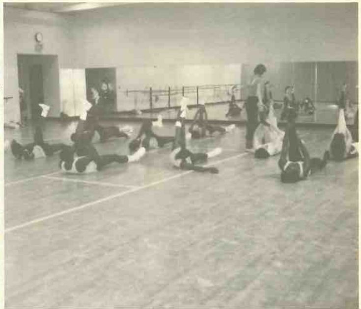
バスケット選手はエアロビクスダンスでトレーニングする

ドミンクスビルズ校の野球、バスケットボール、陸上、ソフトボールなどの選手からの管理を全て行なっている。氏は当然のことながら臨場の知識を充分にもち合わせており、個人的には、クリニックをも経営している。多くの患者の信望も厚い。氏のエピソードの一つとして、夫妻で旅行のため1週間の休暇をとったが、旅行先が気に入ったとして、3カ月間滞在したという。からだも大きくまさらからだに似合った行動であったと大笑いをした。しかし一面では、ドミンクスビルズ校は、黒人の学生が多く、スポーツ選手の割