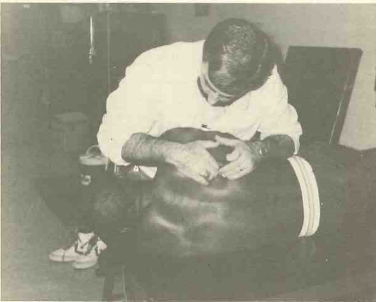
加州大ドミニゲンスヒルトレーナー・フェルプス氏の肩の調節

今回の渡米の目的は、スポーツ王国の一つであるアメリカのスポーツのトレーニングの方法を調べることであった。特に体力ト