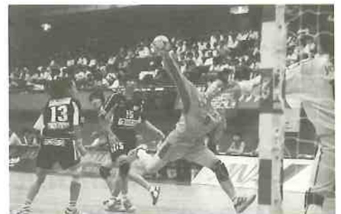
開幕戦から (2005. 9. 3)