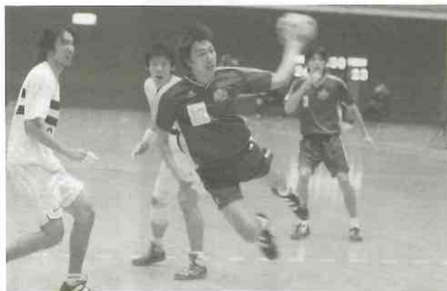
男子優勝 筑波大学

でしまったのですが、「ディフェンスで粘り、ミスの少ないセットオフェンスで点数を積み重ねる」という、本来の筑波大学のハンドボールを2試合とも展開できたので勝利にたげることができたと思います。