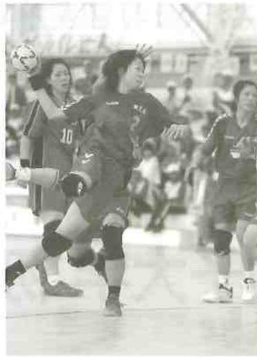
成年女子（写真左）、少年女子（写真右）

当初は全くの手探りと資料集めから始まった『鏡野町の国体』ですが、時間の経過とともに、徐々に民泊を中心とする具体的な全体像を描くことができるようになり、私たちが思い描いた『鏡野町の国体』の一端は実現できたのではないかと思います。また、十分ではない会場設備の中で、連日大会