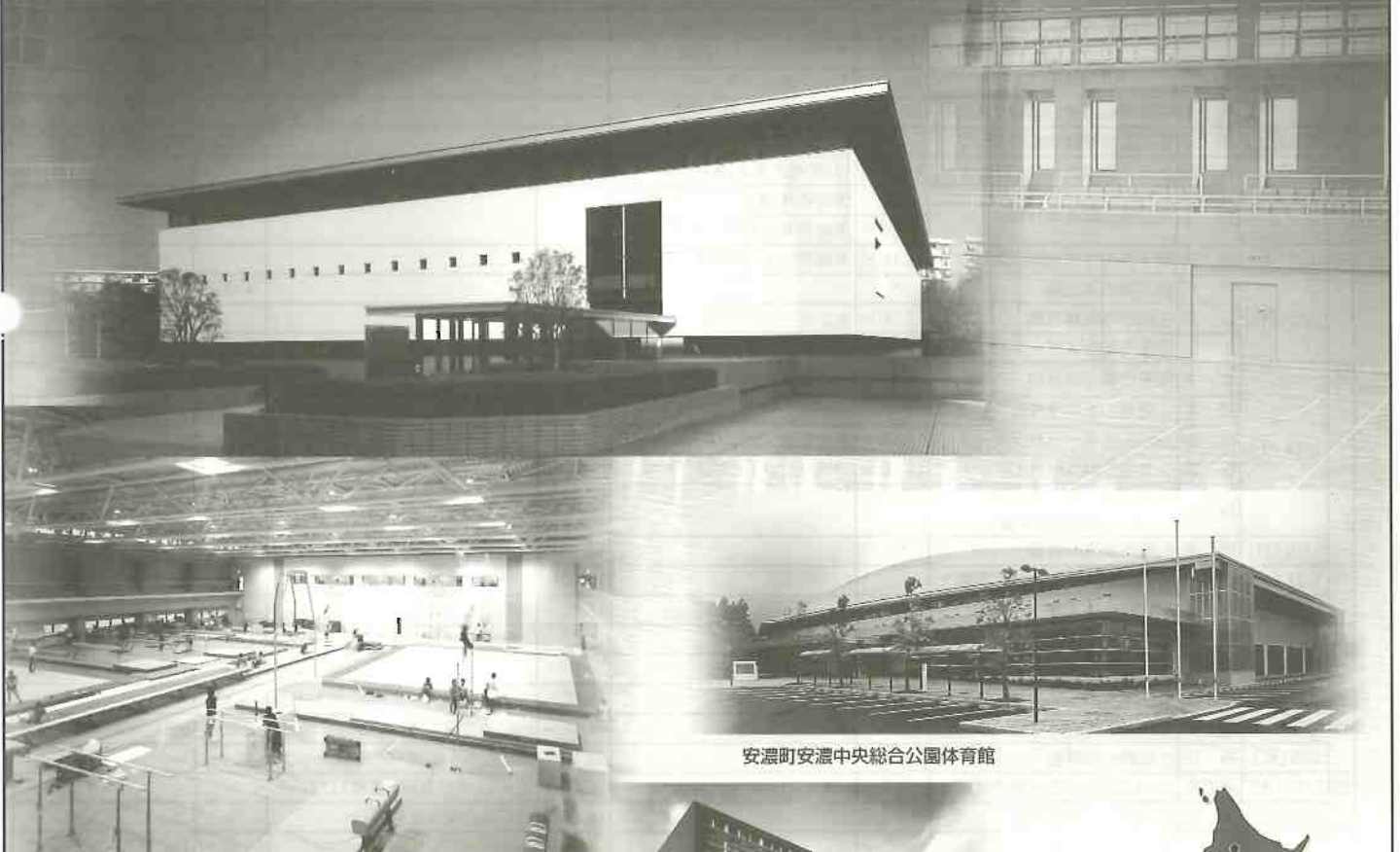
日本体育大学健志台キャンパス体操競技館

自然換気システム「NAV-Window-21」は、 各地の体育館・大空間施設で採用されています。