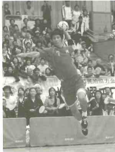
成年男子（写真上）、少年男子（写真下）

ードの保持については、練習も比較的にスムーズに行えましたが、合唱についてはなかなか時間がとれず、週1回のハンドボール教室の練習日にBGM曲を流すことでリズムを覚えてもらうなど、刷り込み的な手法で対応しました。また、「ももっち体操」については、低学年（小学校3年生以下）の教室生に取り組んでもらいましたが、“ハンドボール教室の普段の練習より厳しい”といわれた踊りの練習を8月以降10数回積み重ね、可愛らしい踊り（体操）を晴れの舞台で見事に披露してくれました。