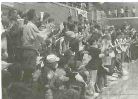
↓ 勝山応援風景 白梅応援風景 →

今まで、「民泊が成功すれば、国体は成功する。」と耳にたこができる程、聞かされてきました。国体が終わるまで半信半疑だったこの言葉を、後催県の担当者に自信を持って贈ることにしたいと思います。