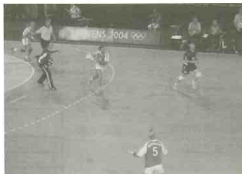
アテネオリンピック女子決勝より

これらの結果から、体格や体力差に対し、どうしても上から攻めることは難しくなる。このため、ディフェンスの間をどのように攻めるかという、横のズレをつくるという攻撃戦術が有効であることが示唆された。