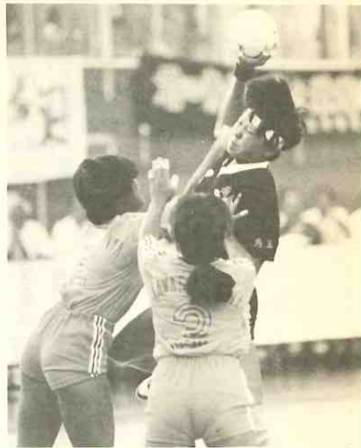
浦和実が接戦を制す